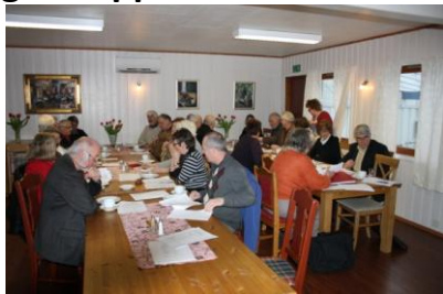
Fra årsmøtet 2011