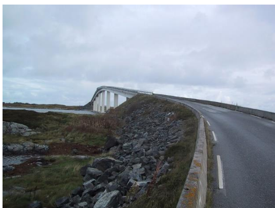
Verjeskiftbrua