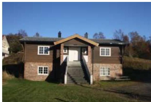
Her kjem Lokalhistorisk arkiv for Smøla

Var det Dyrnes ungdomslag som fekk steinen reist? Er møtebøkene for laget å finne?