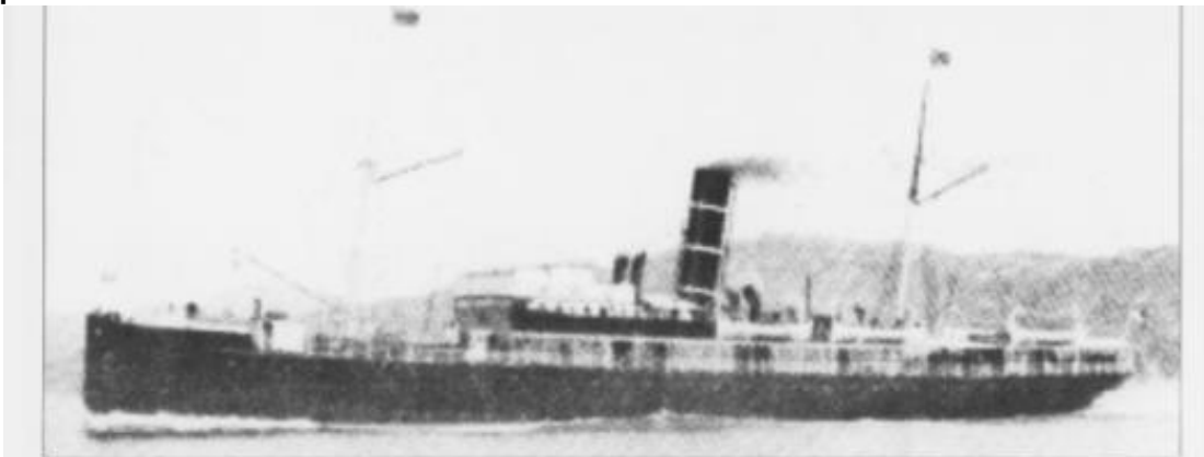
Hurtigruteskipet «Irma» ble torpedert av to norske torpedobåter 13. februar 1944.

Han vil forteller om tragedien med hurtigruteskipet Irma som ved en misforståelse ble skutt i senk ved Hestskjæret fyr av to norske torpedobåter i 1945. 61 mennesker omkom.